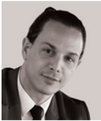
di Loris Scipioni

POLITICA, ATTUALITÀ, SCIENZA E TECNOLOGIA, SALUTE E BENESSERE, CUCINA E RICETTE, STORIA E CULTURA... e molto altro